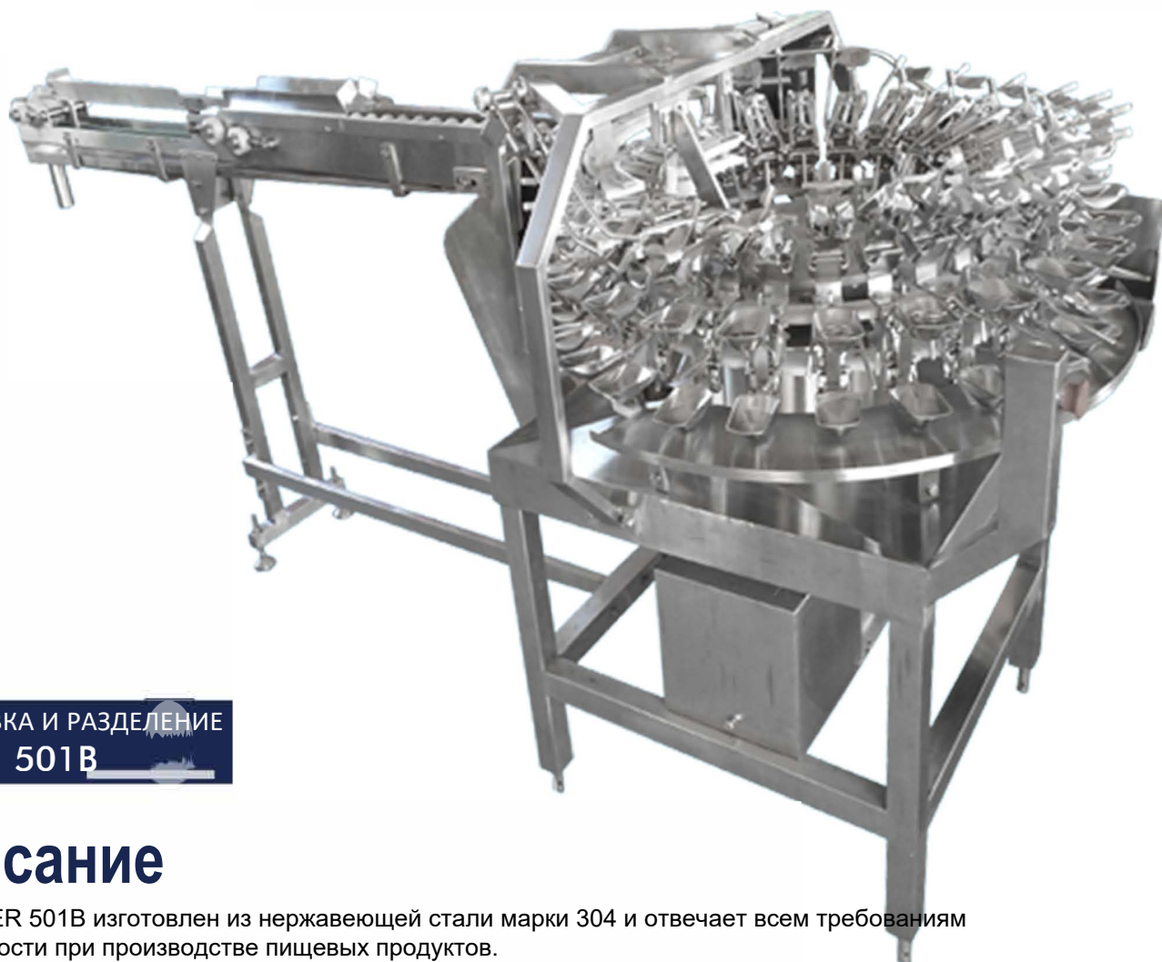
РАЗБИВКА И РАЗДЕЛЕНИЕ ЯИЦ 501В